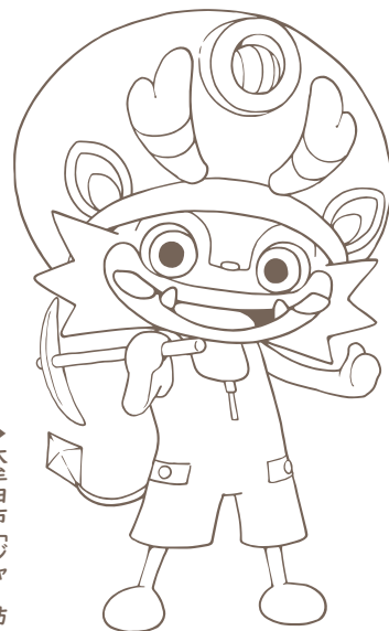
▶大牟田市「ジャーフ」

ここに穴が空いていますので、マスクの片方のひもを通して引っ張るとマスクの収まりが良いです。