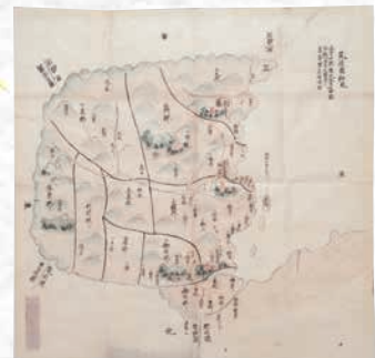
▲筑後国細見絵図（江戸時代中期）