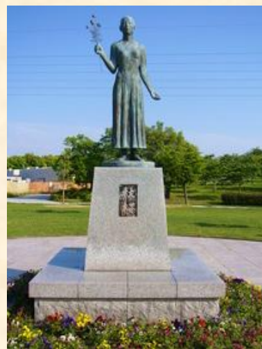
核兵器廃絶平和都市宣言10周年記念 平和モニュメント「秋桜」（諏訪公園） （大牟田市ホームページより）